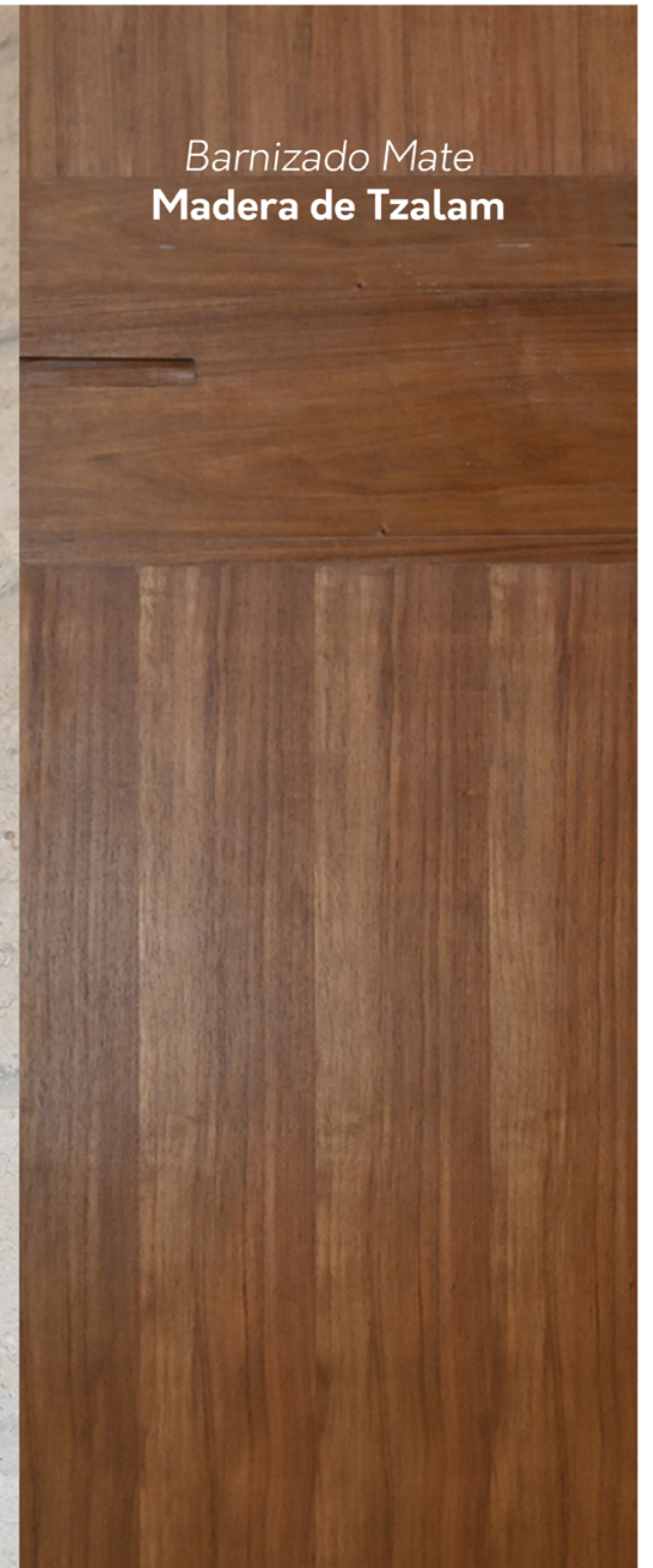
Barnizado Mate Madera de Tzalam