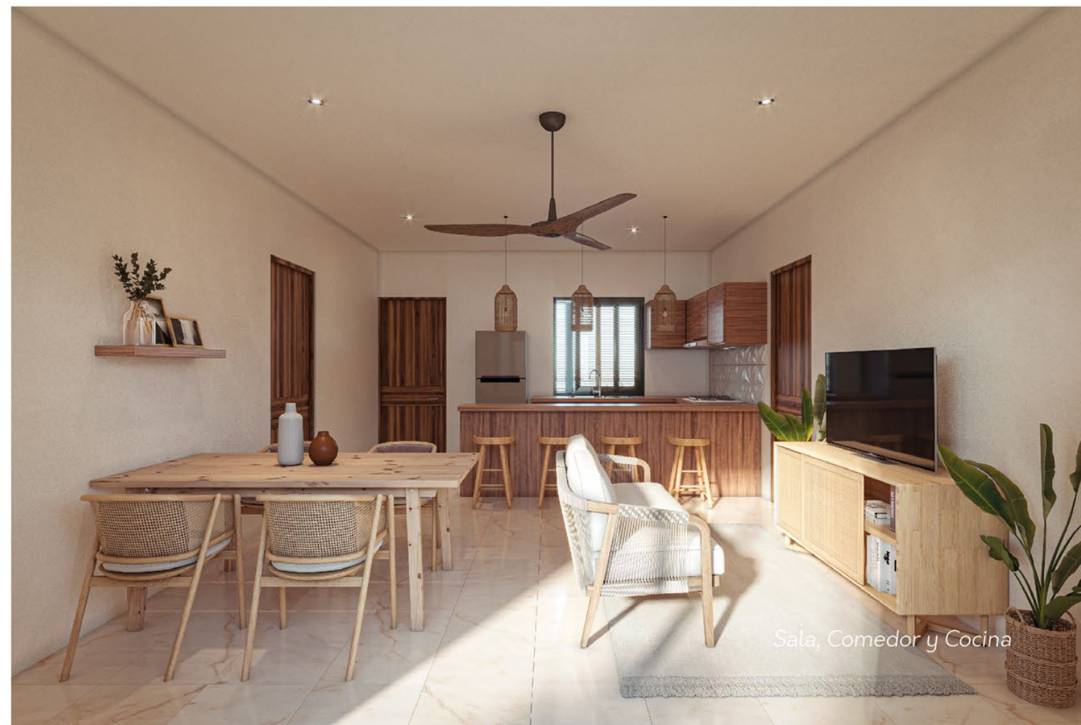
Sala, Comedor y Cocina