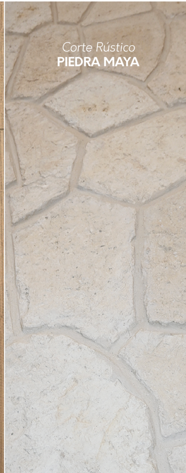
Corte Rústico PIEDRA MAYA