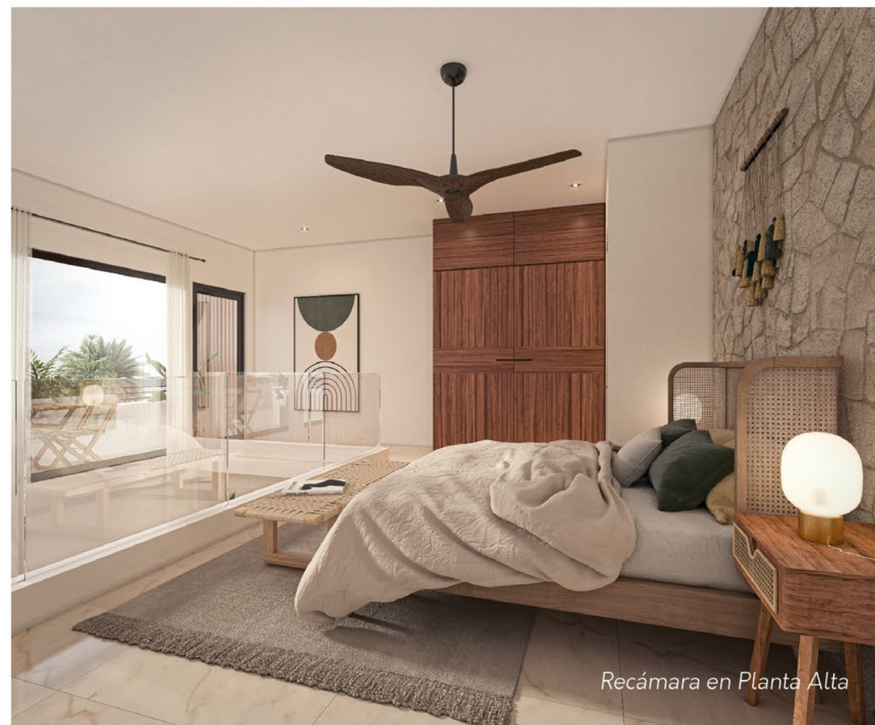
Recámara en Planta Alta

Una nueva forma de vivir en la ciudad, con espacios vastos y luminosos. La doble altura genera un ambiente de mayor comodidad. Un nivel para convivir y otro con mayor privacidad, siendo parte de la mejor tendencia.