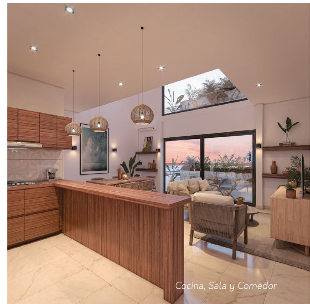
Cocina, Sala y Comedor