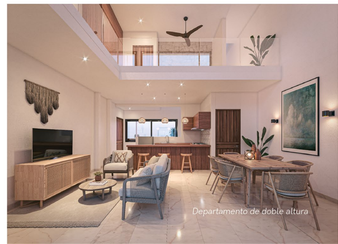
Departamento de doble altura