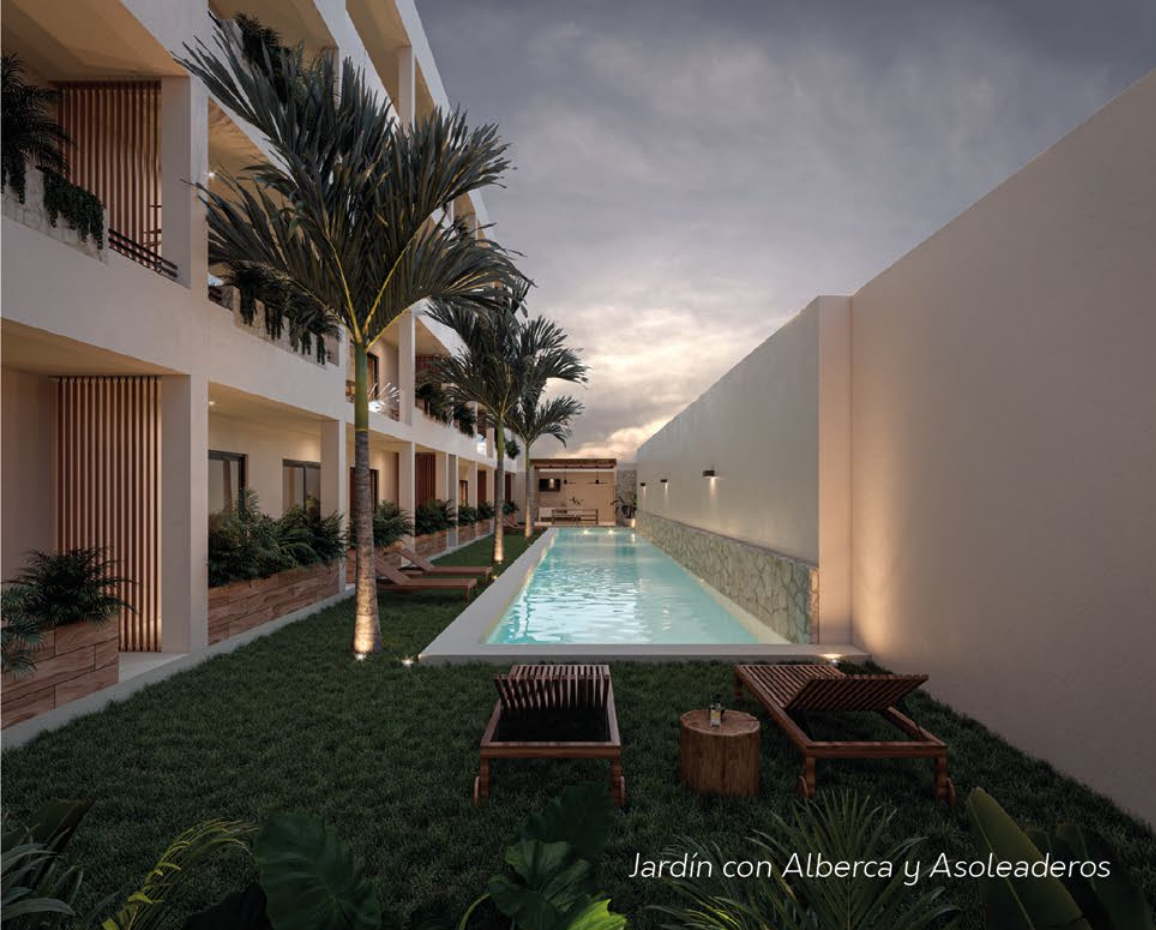
Jardín con Alberca y Asoleaderos