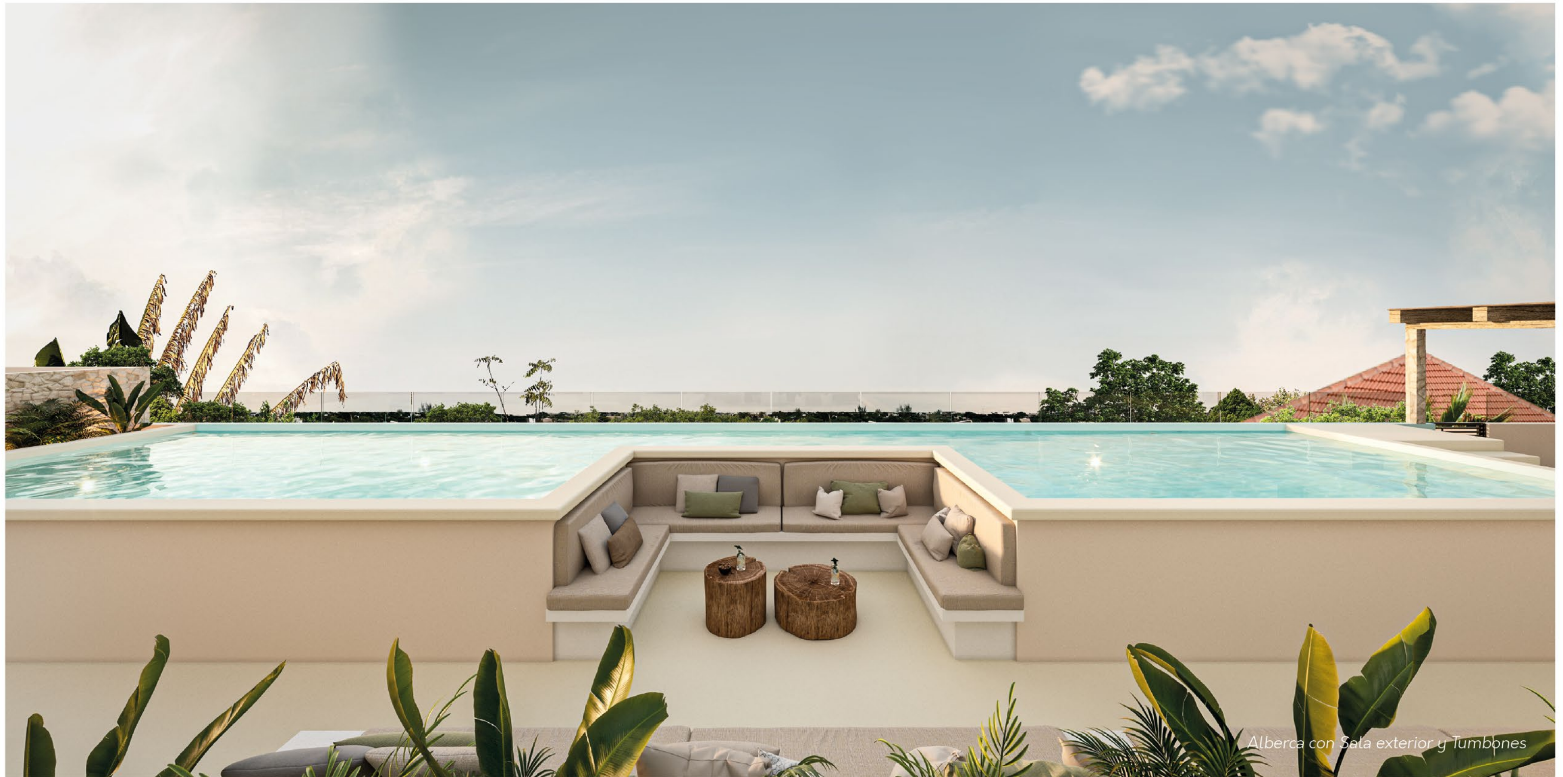
Alberca con Sala exterior y Tumbones

Roof Top adecuado para refrescarte en la alberca, asolearte en el tumbón o solo convivir y compartir.