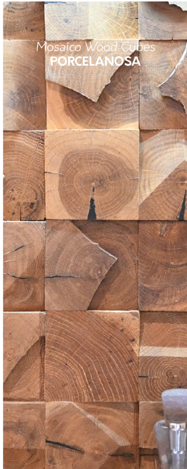
Mosaico Wood Cubes PORCELANOSA

Cada material colocado se diseñó para potencializar la experiencia y tus sentidos. Elegidos cuidadosamente por su apariencia y calidad, dejando una atmósfera sofisticada y relajada en cada detalle.