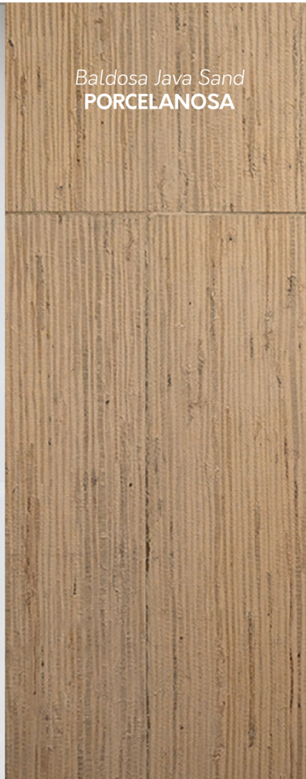
Baldosa Java Sand PORCELANOSA