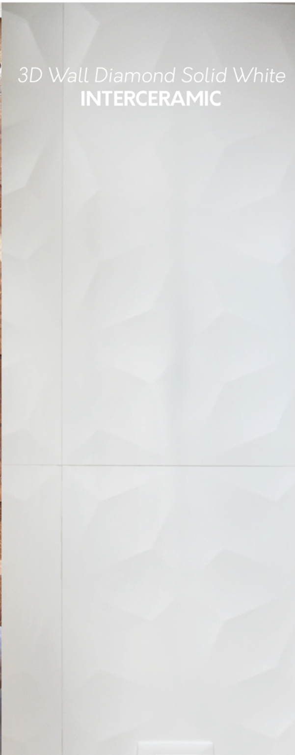
3D Wall Diamond Solid White INTERCERAMIC