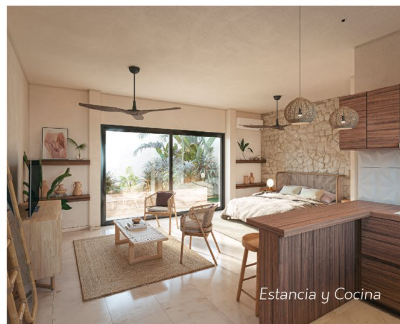
Estancia y Cocina