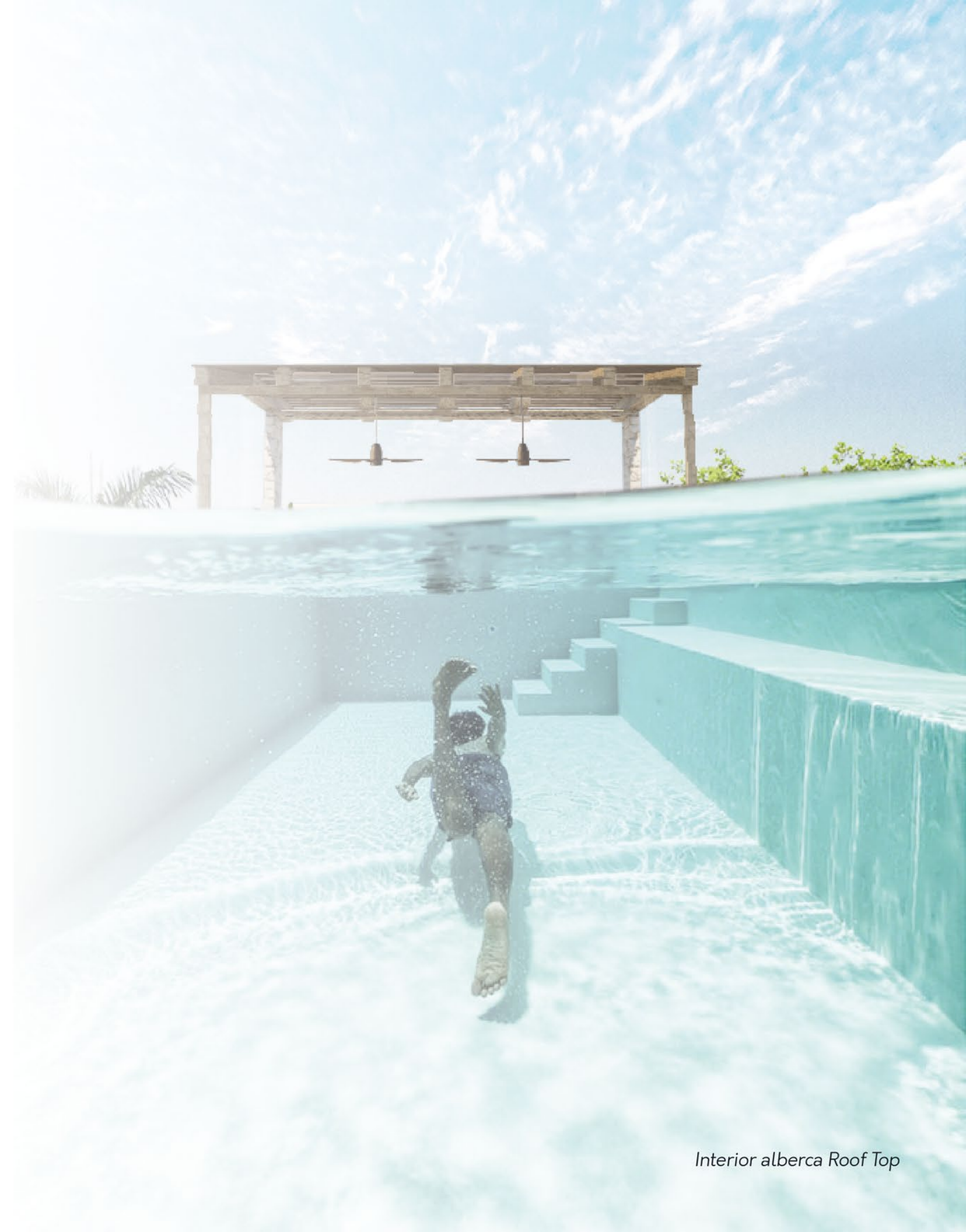
Interior alberca Roof Top